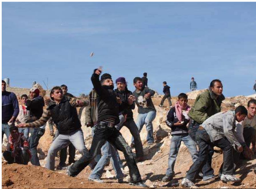
Un grup de joves palestins s'enfronta amb pedres a les tropes israelís en